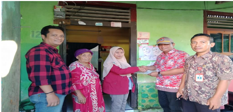
Gambar 3.6. penyerahan akte kematian