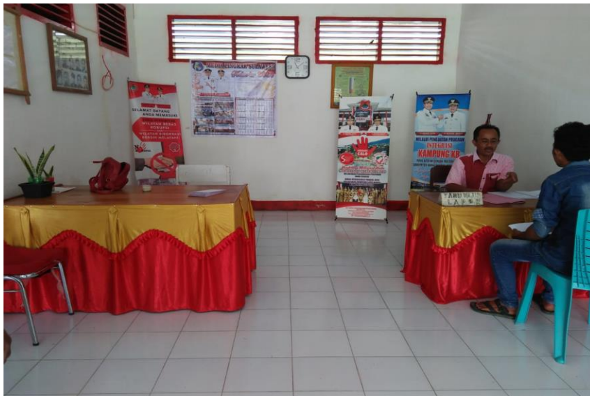
Gambar 3.5. aktifitas pelayanan.