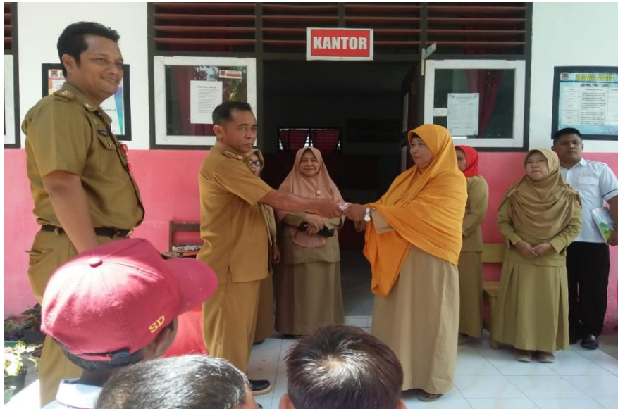
Gambar 3.6. penyerahan kartu KIA