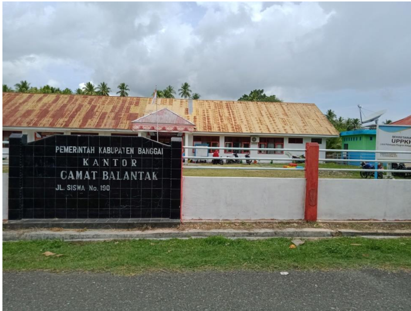
Gambar 3. 2 . kantor Camat Balantak