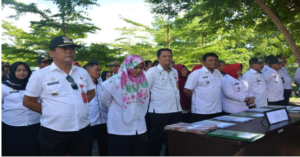
Gambar 3.4. penandatanganan perjanjian kinerja dan Inovasi