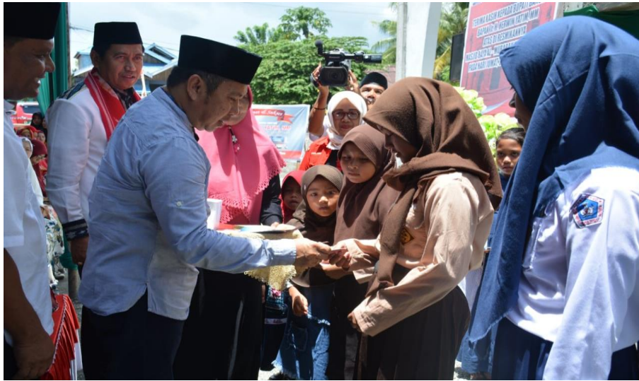
Gambar 3.7. Bupati dan Wakil Bupati Banggai saat launching Inovasi jempol pore AKKsikan serta menyerahkan KIA secara simbolis.

Dari Tabel diatas di gambarkan bahwa untuk indikator Nilai Akuntabilitas Kinerja Kecamatan Sementara untuk indikator Indeks Kepuasan Masyarakat dan indikator Nilai Capaian Kinerja Penyelenggaraan Pemerintahan Kecamatan capaian realisasinya rata-rata sangat tinggi. Hal ini menunjukkan bahwa Pemerintah Kecamatan Balantak konsisten dengan apa yang telah direncanakan.