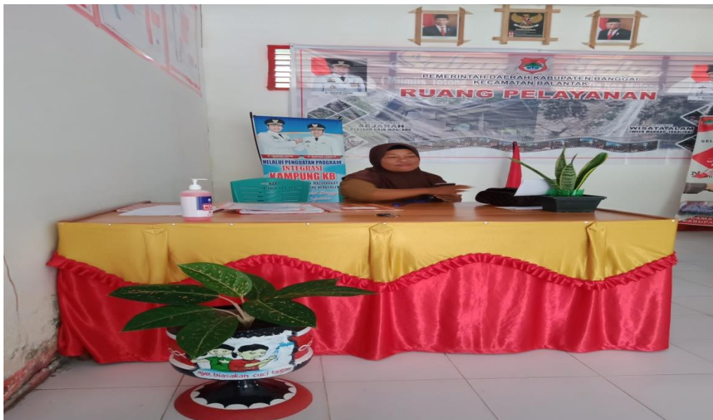
Gambar 3.3 .ruang pelayanan